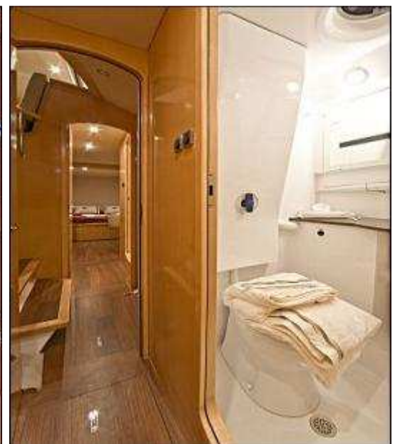
Cabine double avec cabinet de toilettes